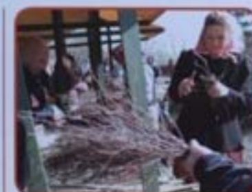
Påskkvastar tillverkas