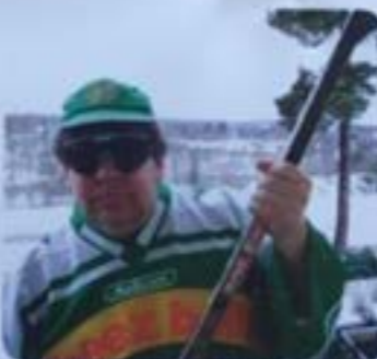
Benny vaktande hellen från intrångare