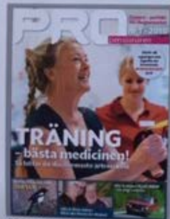
PRO:s Medlemsidning 8 ggr/år

PRO påverkar och gör skillnad i frågor som är viktiga för äldre. Det handlar om ekonomin, boende, vård och omsorg och inte minst åldersdiskriminering.